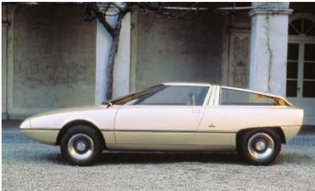
Camargue fait partie de ASI-Bertone Collection.

C'EST AU SALON DE L'AUTOMOBILE DE GENÈVE DU PRINTEMPS 1972 QU'EST DÉVOILÉ CET INCROYABLE PROTOTYPE.