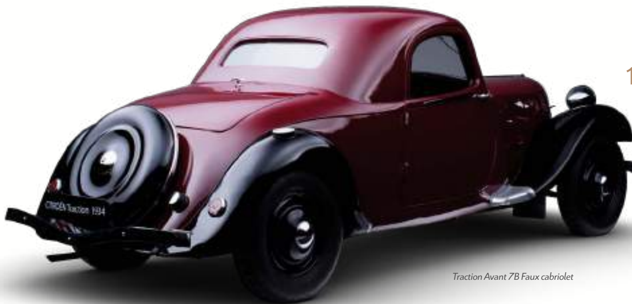
Traction Avant 7B Faux cabriolet

VÉRITABLE RUPTURE PAR RAPPORT AUX VOITURES LANCÉES PAR LA MARQUE, LA PREMIÈRE TRACTION VOIT LE JOUR EN AVRIL 1934.